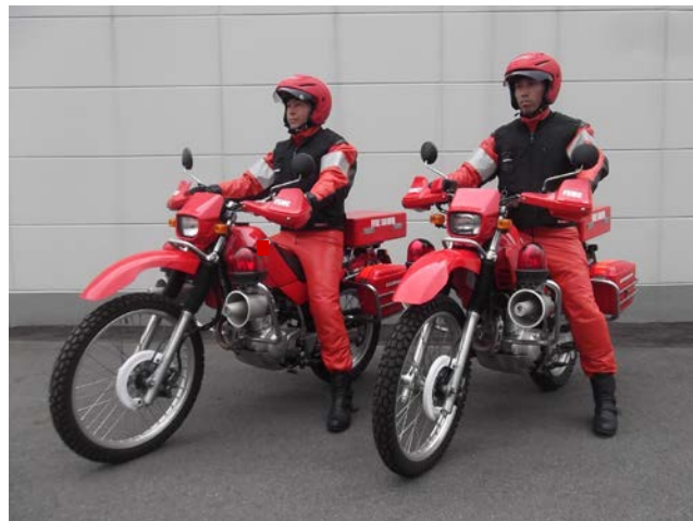
ベスト着用時の乗車状況