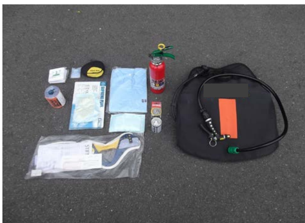
積載資機材例（消火用資機材、救急資機材等）