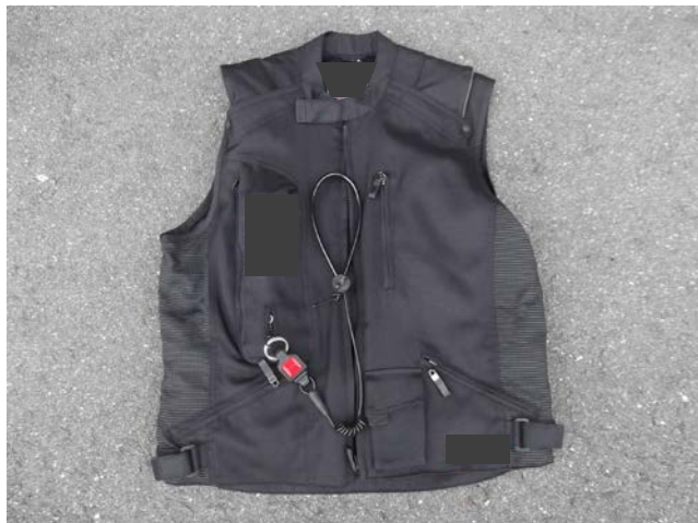
バイク用エアバックベスト例